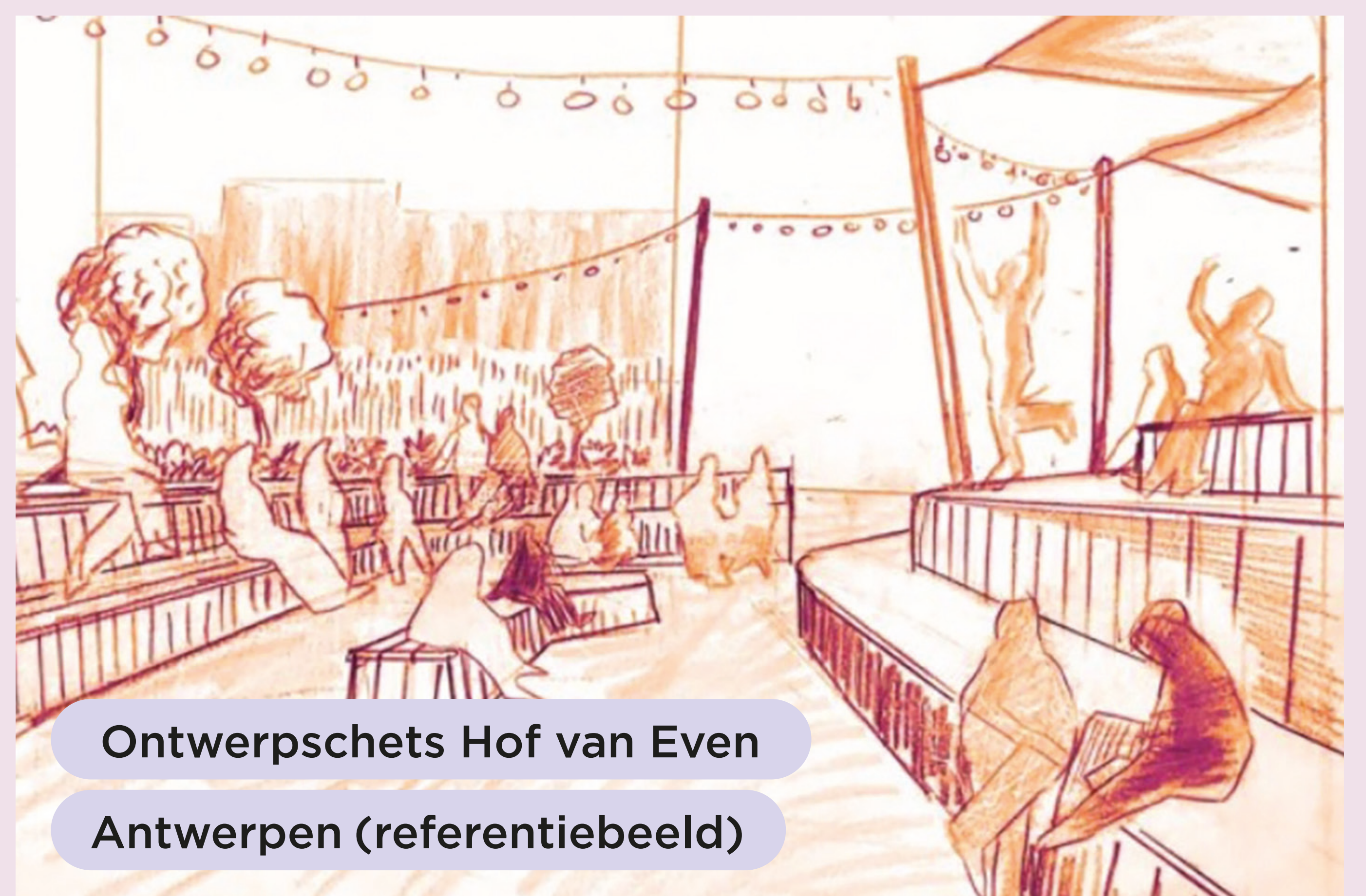
Ontwerpschets Hof van Even