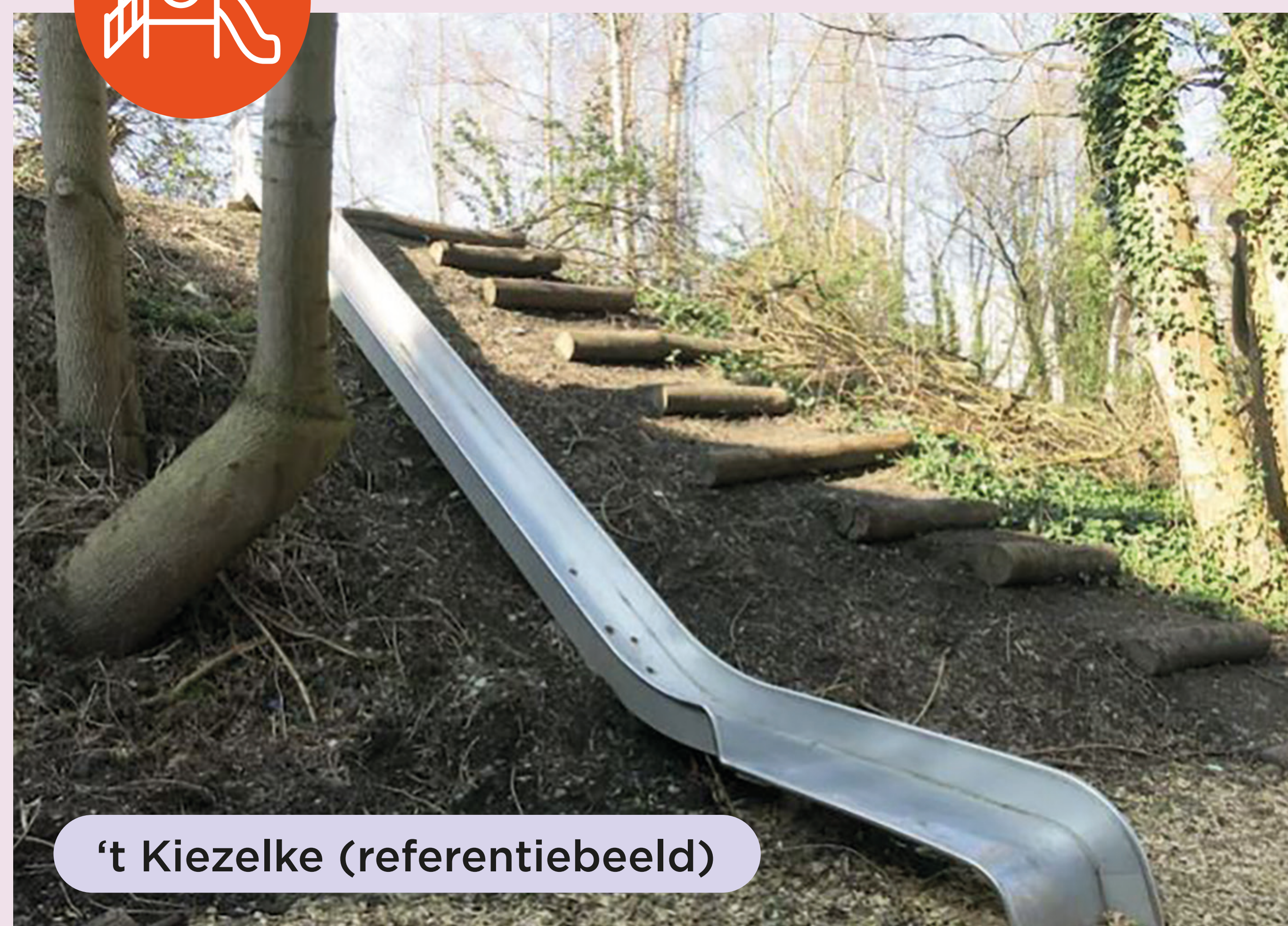
't Kiezelke (referentiebeeld)