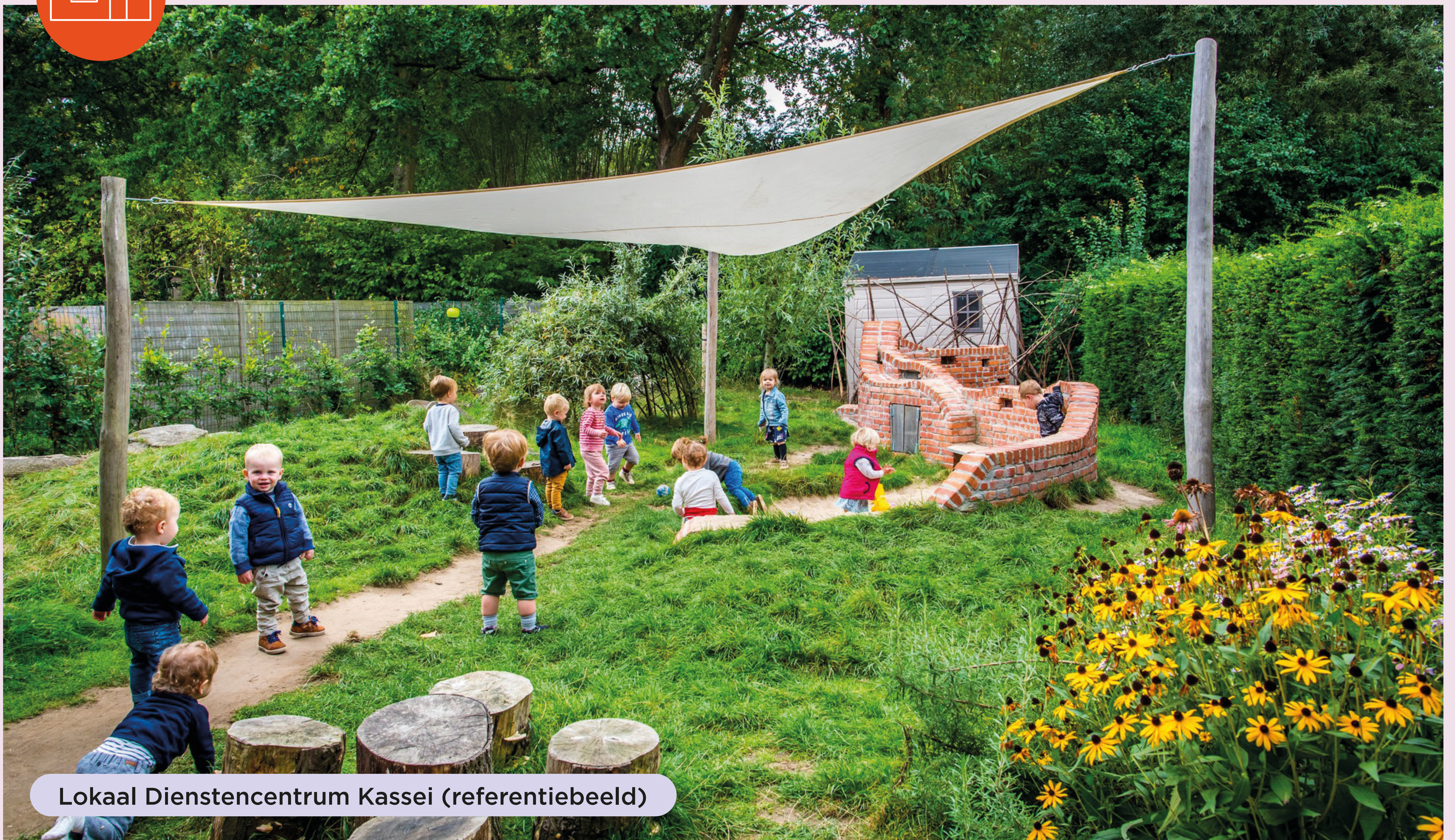
Lokaal Dienstencentrum Kassei (referentiebeeld)