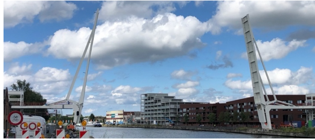
De nieuwe fietsbrug in aanbouw (juni 2022)

Voorstel voor een naam voor de nieuwe fietsbrug in Vilvoorde