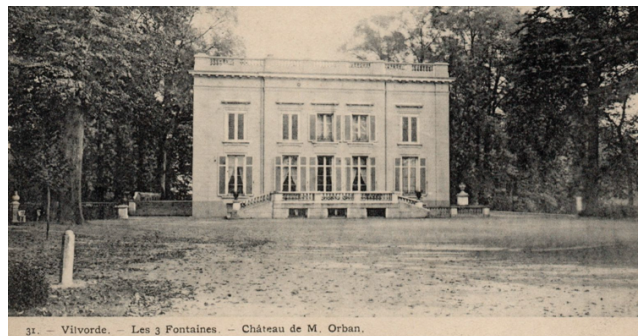
Het verdwenen kasteel "De Drie Fonteinen"

Oorspronkelijk liep er een lange dreef naar het verdwenen kasteel "De Drie Fonteinen". De ingang van die dreef lag op de plek waar nu DPG Media (VTM) ligt. Aan de ingang van de dreef stonden twee statige leeuwen in blauwe hardsteen. De laatste eigenaar van het kasteel, Daniël Campion, was een verwoed liefhebber van oude stenen en beelden.