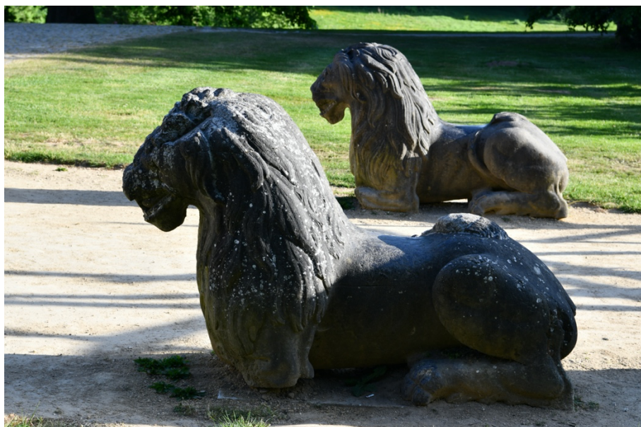
De twee leeuwen op hun huidige plaats in het park

Oorspronkelijk liep er een lange dreef naar het verdwenen kasteel "De Drie Fonteinen". De ingang van die dreef lag op de plek waar nu DPG Media (VTM) ligt. Aan de ingang van de dreef stonden twee statige leeuwen in blauwe hardsteen. De laatste eigenaar van het kasteel, Daniël Campion, was een verwoed liefhebber van oude stenen en beelden.