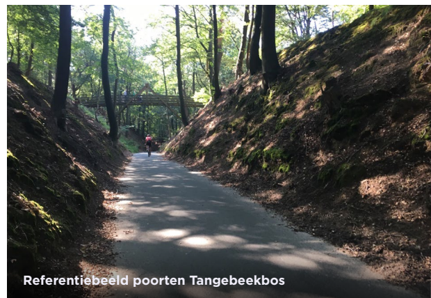
Referentiebeeld poorten Tangebeekbos