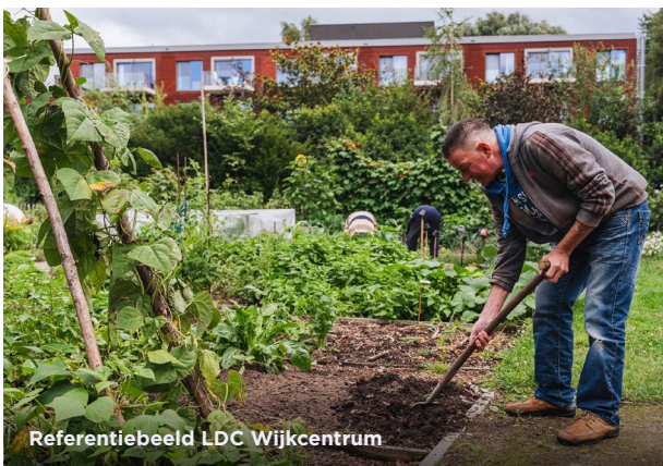
Referentiebeeld LDC Wijkcentrum

Europaplein: aandacht voor biodiversiteit en spelaanleiding voor kinderen door schilderwerken